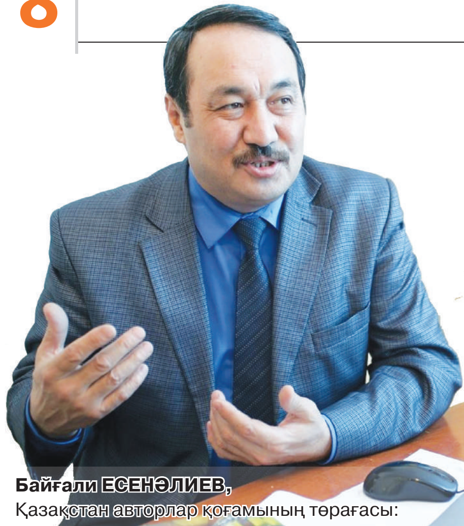
Байғали ЕСЕНӘЛИЕВ, Қазақстан авторлар қоғамының төрағасы: