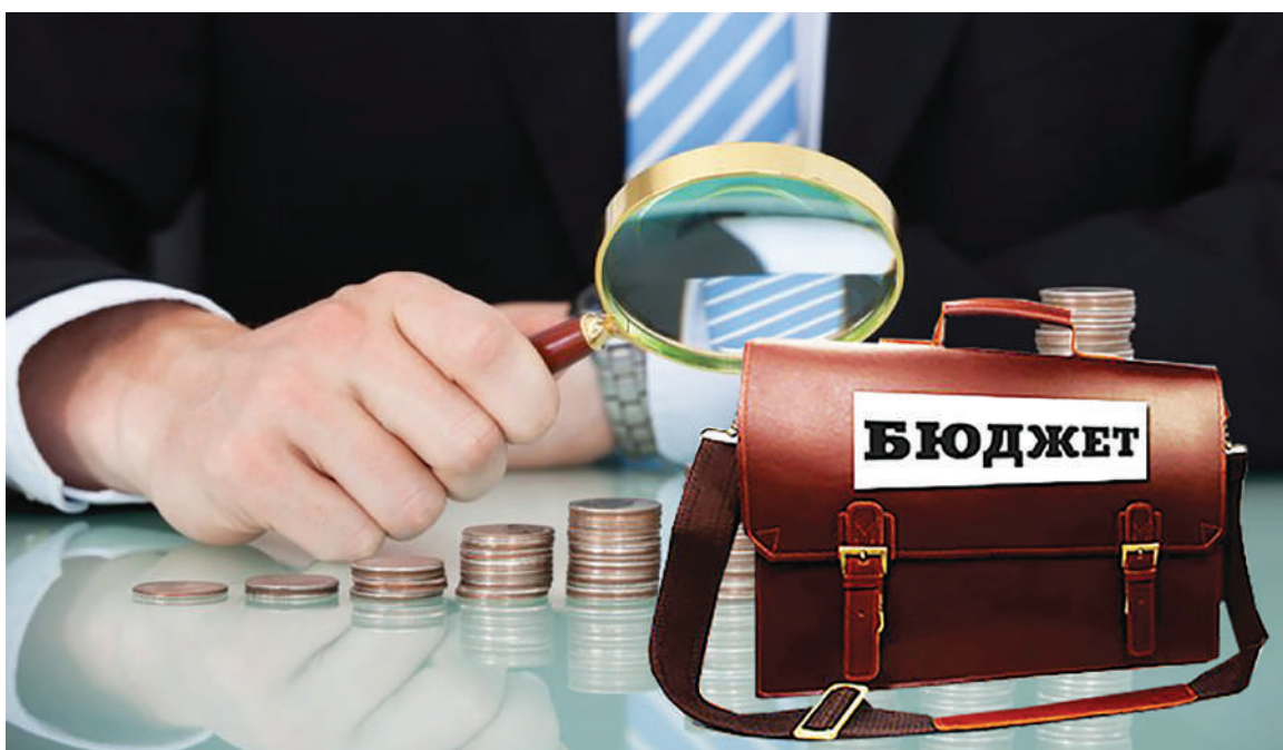
Құпия САЛАТҚА (Салат)

— Шынында, 2022 жылы республикалық бюджетті сегіз рет түзеттік. Жалпы, бұл процедуралар